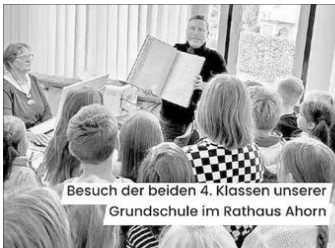
Besuch der beiden 4. Klassen unserer Grundschule im Rathaus Ahorn