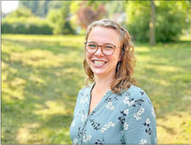
Tag der Pflegeausbildung 2024