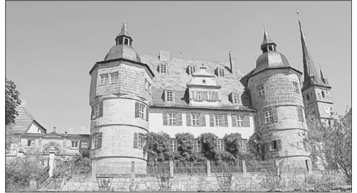
Das Schloss Ahorn fand bereits Ende des 11. Jahrhunderts in einer Schenkungsurkunde als „Burg Ahorny“ Erwähnung.

Die Teilnahme ist kostenlos, die Teilnehmerzahl auf 25 Personen begrenzt. Eine Anmeldung ist erforderlich bis zum 21.3. unter post@initiative-rodachtal.de oder Telefon 036871-30317