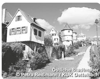
Östliche Stadtmauer