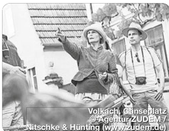
Volkach, Gänseplatz